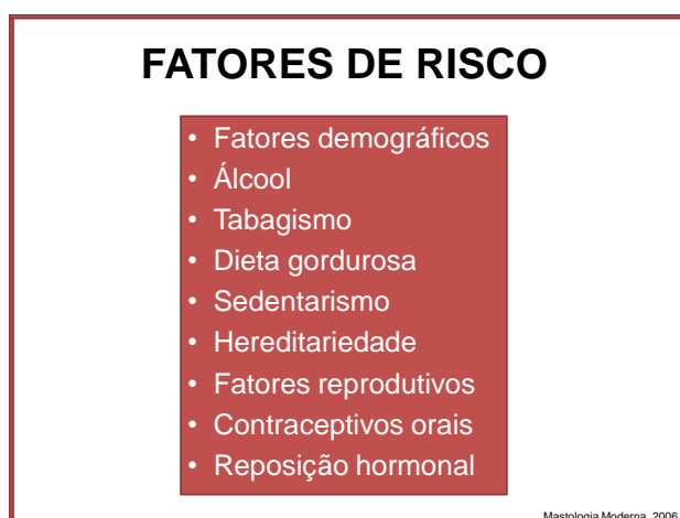
Imagem 3: Fatores de risco para câncer de mama

O auto exame das mamas : Aproximadamente 80% dos tumores são descobertos pela própria mulher no auto-exame. Nódulos pequenos podem não ser sentidos, por isso é importante ressaltar que o auto exame, junto a exames periódicos, pode salvar vidas.