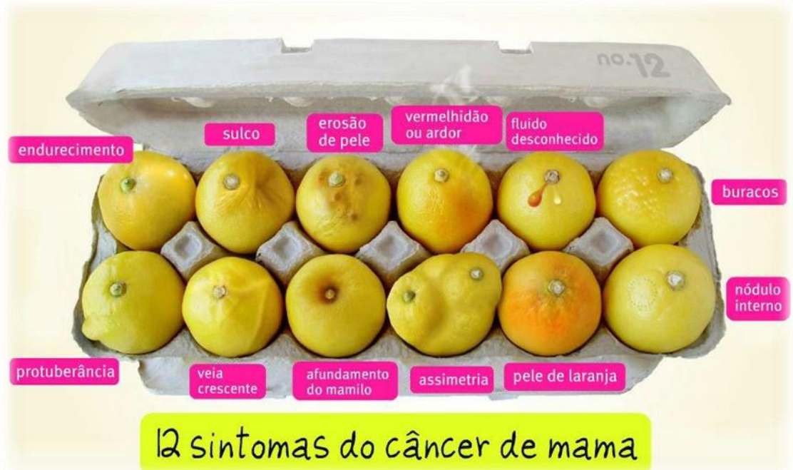
Imagem 4: Sinais sugestivos de Câncer de Mama

O câncer de mama possui significativos índices de cura, que giram em torno dos 95% quando descoberto precocemente.